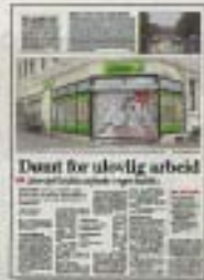
Dagbladet 11. september