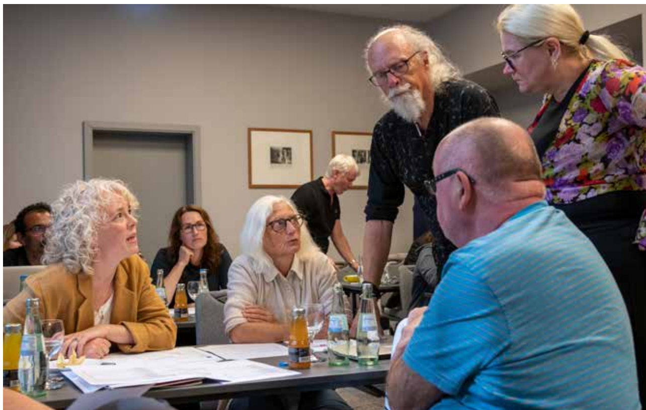
Representanter fra NTL kunst - og kulturutdanning i dyp diskusjon.

«AT VI KAN MØTES OG DELE ERFARINGER FRA HVER VÅR KANT ER VELDIG VIKTIG.»