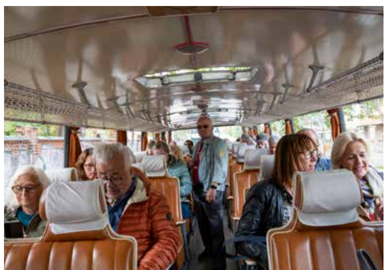
OVER: NTL'ere i interiør fra 1978.