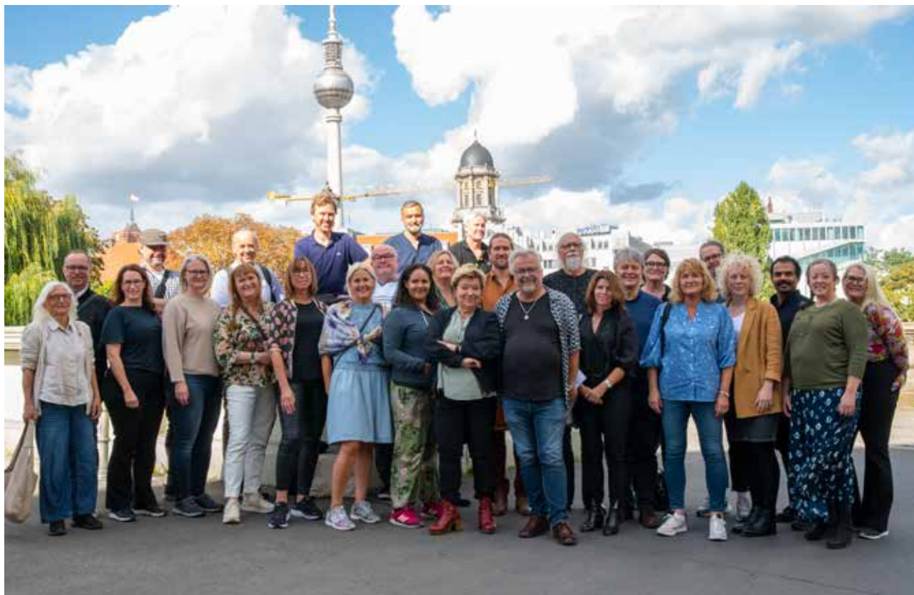
GJENGEN SAMLET: Årets deltakere på NTL Kulturinstitusjoners representantskapsmøte i Berlin, september 2022.

<<VI ER LANGT FRA MÅLET OM 1 % AV STATSBU DSJETTET TIL KULTUR.>>