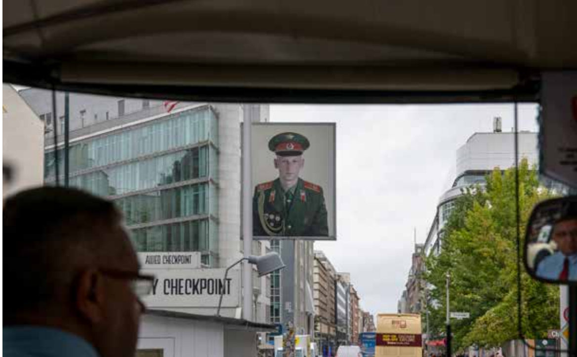
TIL VENSTRE: Her passeres Checkpoint Charlie.