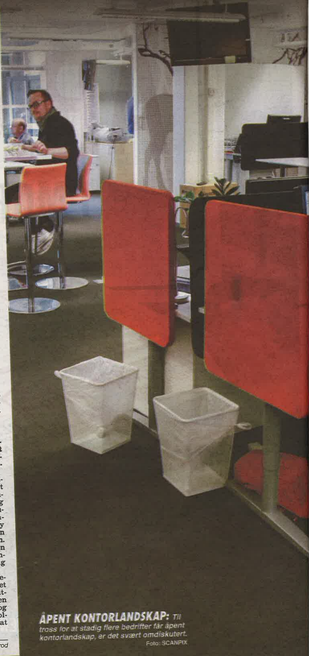
ÅPENT KONTORLANDSKAP: Til tross for at stadig flere bedrifter får åpent kontorlandskap, er det svært omdiskutert.