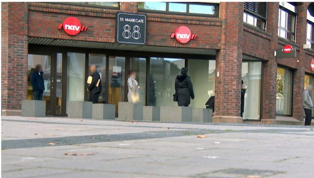
VENTESONE: Flere Nav-brukere sto mandag i ventesonen utenfor Nav-kontoret i Sarpsborg sentrum.

I flere måneder har Nav-brukere i Sarpsborg vært nødt til å vente i gågata. Nå endres praksisen etter at lokalavisa tok opp saken.