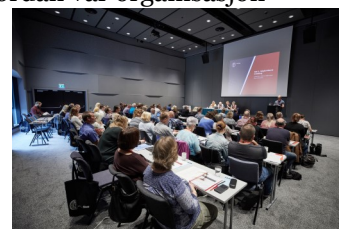
Bilde fra representantskapsmøtet i 2018.

Vi har jobbet med representantskapsmøtet en stund allerede men nå begynner det å tilspisse seg i form av invitasjon av gjester, program for konferansen, valgkomiteen skal igangsettes, avdelingene våre må starte arbeidet med sine representanter og mye, mye mer.