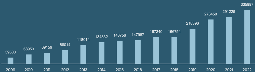
Antall saker per år for LO-medlemmer siden oppstarten i 2009