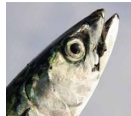
Eksempel på makrell.

Epilog om sex og grådighet: Kvirinius beholder innflytelsen inn i keiser Tiberius regjeringstid. Han er nå en gammel mann, men svært rik. Han blir gift med den unge Aemilia Lepida i år 20, barnebarnet til triumviren Lepidus, som også hadde vært romersk yppersteprest etter Julius Caesar. Hun blir gravid og påstår Kvirinius nå får en arving. Den rettskafne Publius Kvirinius protesterer imidlertid. Det er umulig for meg å være faren, hevder han. Han skiller seg i stedet, og dør barnløs året etter