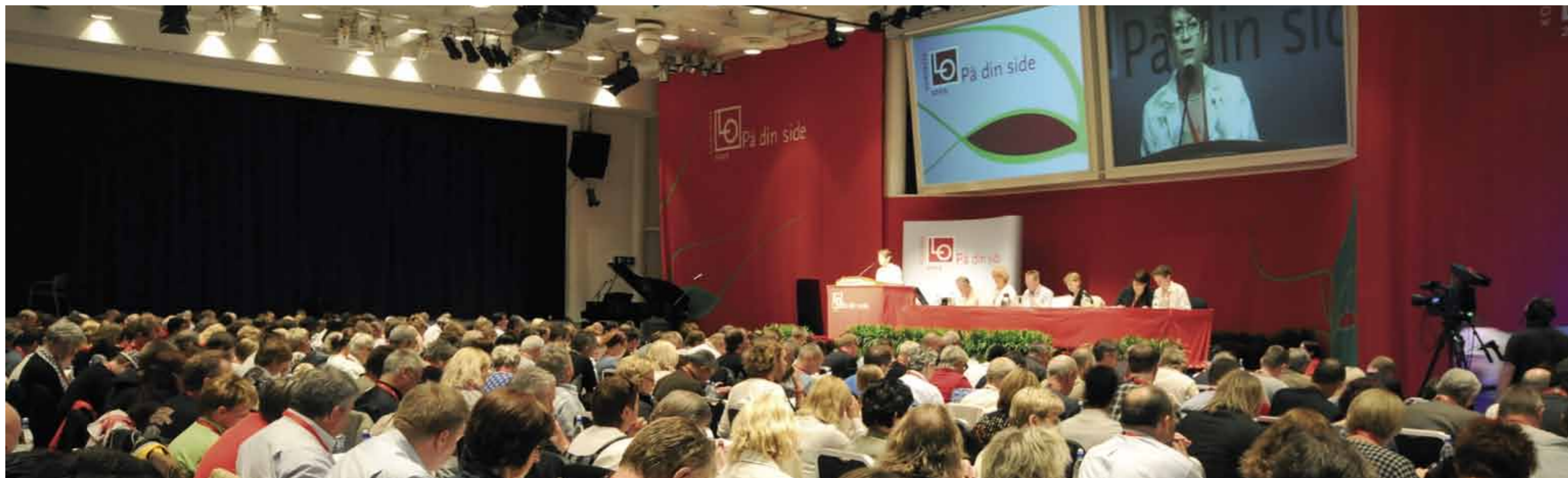
Bilde fra LO-kongressen i 2009.