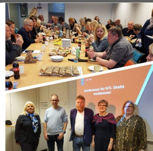
Fra konferansen på Skien skattekontor.

Denne uken har Haugesund, Stavanger, Leikanger og Steinkjer fått besøk. Det meldes om gode konferanser som blir godt mottatt. Vi håper dere setter pris på besøkene fra våre dedikerte tillitsvalgte.